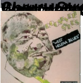
Roosevelt Sykes - West Helena Blues