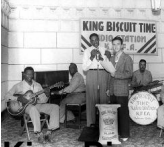
King Biscuit Time, 1941