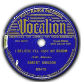
Vocalion Records - I Believe I'll Dust My Broom 1936

I'm gonna get up in the mornin', I believe I'll dust my broom (2x) Girlfriend, the black man you been lovin', girlfriend, can get my room I'm gon' write a letter, Telephone every town I know (2x) If I can't find her in West Helena, She must be in East Monroe, I know I don't want no woman, Wants every downtown man she meet (2x) She's a no good doney, They shouldn't 'low her on the street I believe, I believe I'll go back home (2x) You can mistreat me here, babe, But you can't when I go home And I'm gettin' up in the morning, I believe I'll dust my broom (2x) Girlfriend, the black man that you been lovin', Girlfriend, can get my room I'm gon' call up Chiney, She is my good girl over there (2x) If I can't find her on Philippine's Island, She must be in Ethiopia somewhere