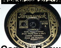
Connie Boswell, singel 1934