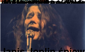
Janis Joplin śpiewa "Little Girl Blue"