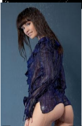
Famous Blue Raincoat