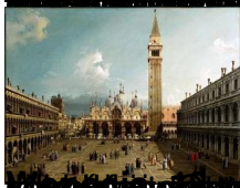
Adagio Oboe Concerto in D major