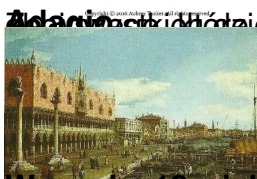
Wenecja, 18 wiek (Canaletto)