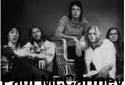
Paul McCartney & Wings

Wtorek, 29 Marzec 2016 16:34 - Zmieniony Wtorek, 29 Marzec 2016 16:43