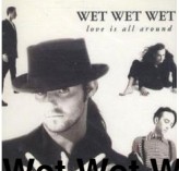
Wet Wet Wet - Love Is All Around, Single 1994